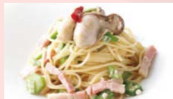
牡蠣 ベーコン オクラのペペロンチーノ