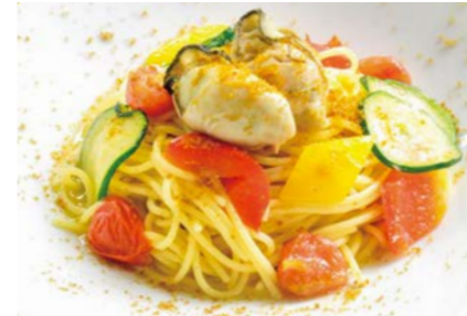
本日の牡蠣パスタ 〇〇♯ ※内容はスタッフへ お問い合わせください。 サラダ / 牡蠣スープ 付き ¥1,280 (税込¥1,408)