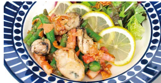
牡蠣とベーコン、アスパラガスのネギ塩ソテー 〇♯ 牡蠣スープ / 十八穀米ごはん or パン1個 付き ¥1,380 (税込¥1,518)