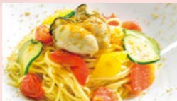
本日の牡蠣パスタ ※内容はスタッフにお問い合わせください。