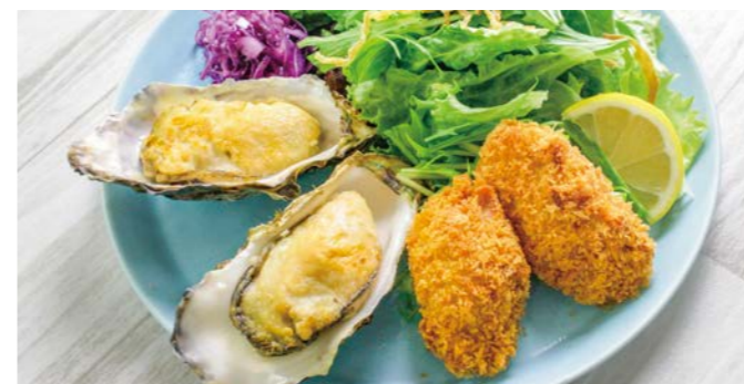
牡蠣のダブルランチ 〇〇♯ ¥1,380 (税込¥1,518) 牡蠣スープ / 十八穀米ごはん or パン1個 付き