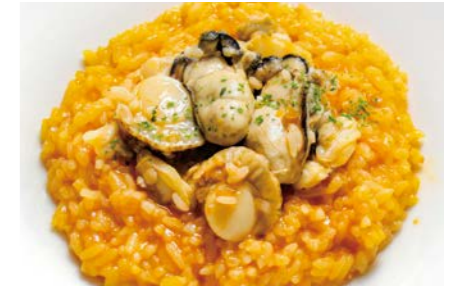
牡蠣と貝類のトマトリゾット 〇〇♯ サラダ / 牡蠣スープ 付き ¥1,280 (税込¥1,408)