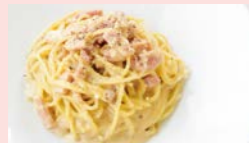
濃厚ウニとベーコンのカルボナーラ