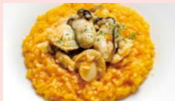
牡蠣と貝類のトマトリゾット

アレルギー表示: 卵 〇 乳製品 ㊦ 小麦 ㇏ 落花生 ㇏ そば ㇏ エビ ㇏ カニ ㇏