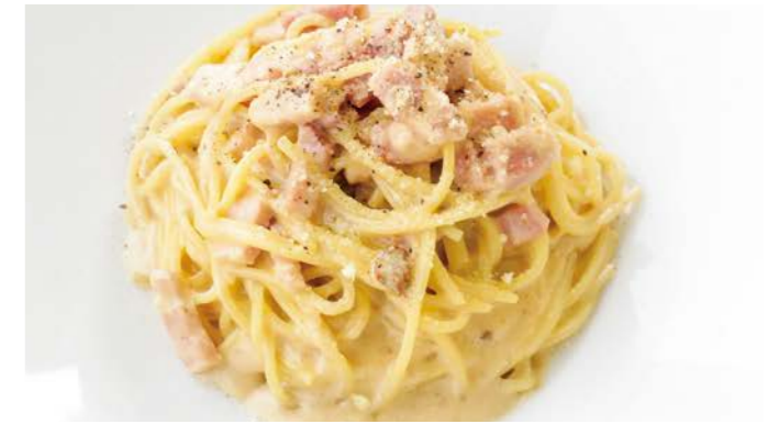
濃厚ウニとベーコンのカルボナーラ 〇〇♯ サラダ / 牡蠣スープ 付き ¥1,180 (税込¥1,298)