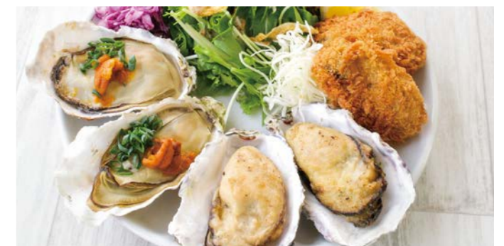
牡蠣のトリプルランチ 〇〇♯ ¥1,780 (税込¥1,958) 牡蠣スープ / 十八穀米ごはん or パン1個 付き