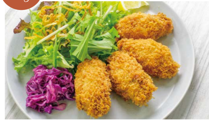
牡蠣フライ4ピースセット 〇〇♯ ¥1,180 (税込¥1,298) 牡蠣スープ / 十八穀米ごはん or パン1個 付き