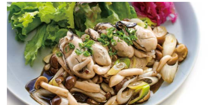
牡蠣と野菜の炭火焼き風ランチ ♯ ¥1,380 (税込¥1,518) 牡蠣スープ / 十八穀米ごはん or パン1個 付き