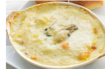
牡蠣とチーズのクリームグラタン 〇〇♯ サラダ / 牡蠣スープ / パン2個 付き ¥1,280 (税込¥1,408)