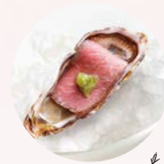
ローストビーフと ワサビ