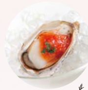
魚介と トマトソース