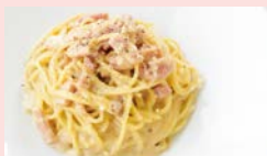
濃厚ウニとベーコンのカルボナーラ