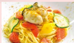
本日の牡蠣パスタ ※内容はスタッフにお問い合わせください。