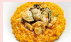
牡蠣と貝類のトマトリゾット