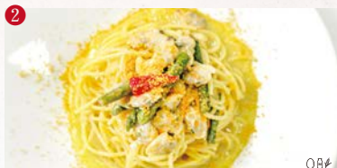
2 〇卵 〇乳製品 〇小麦 〇落花生 〇そば 〇エビ 〇カニ アサリとアスパラのベベロンチーノ カラスミかけ