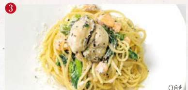
3 〇卵 〇乳製品 〇小麦 〇落花生 〇そば 〇エビ 〇カニ 牡蠣とサーモン、季節野菜のタブナードクリームパスタ