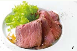
牛肉のタリアート ～ワサビとマッシュポテトとトリュフのソース～