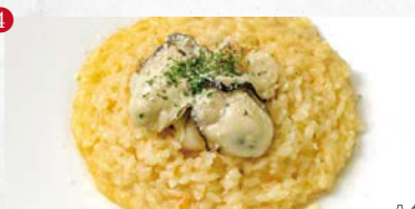
牡蠣とホタテのクリームリゾット