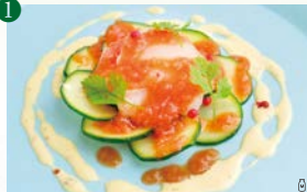
ホタテと野菜のマリネのカルパッチョ ～完熟トマトのドレッシング～