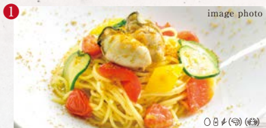
1 〇卵 〇乳製品 〇小麦 〇落花生 〇そば 〇エビ 〇カニ 本日のお勧めパスタ 内容はスタッフへおたずねください。