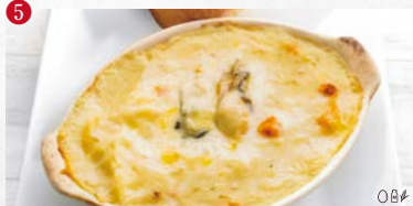
5 〇卵 〇乳製品 〇小麦 〇落花生 〇そば 〇エビ 〇カニ 牡蠣とチーズのクリームグラタン