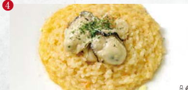
4 〇卵 〇乳製品 〇小麦 〇落花生 〇そば 〇エビ 〇カニ 牡蠣とホタテのクリームリゾット