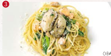
牡蠣とサーモン、季節野菜のタブナードクリームパスタ