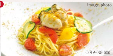
本日のお勧めパスタ 内容はスタッフへおたずねください。