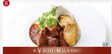
6 〇卵 〇乳製品 〇小麦 〇落花生 〇そば 〇エビ 〇カニ +¥800 (税込¥880) 【肉料理】 牛バラ肉の赤ワイン煮込み牡蠣のバターソース添え