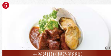
【肉料理】 牛バラ肉の赤ワイン煮込み牡蠣のバターソース添え