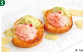
ネギトロとアボカドのブルスケッタ ～ハーブエッグソース～