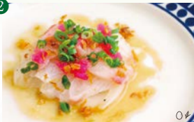
鮮魚のカルパッチョ ～玉葱のマリネと多良岳わさびのドレッシングで～